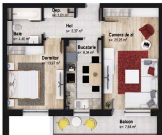
Poziționare pe nivel

În apartamentele cu două camere, fiecare metru pătrat este folosit eficient astfel încât vă puteți amenaja după preferințe spațiul de locuit. Livingul are un spațiu generos, special creat pentru a "scrie" în viață povești plăcute cu familia, bucătăria este largă și spațioasă, iar dormitorul liniștit și relaxant.